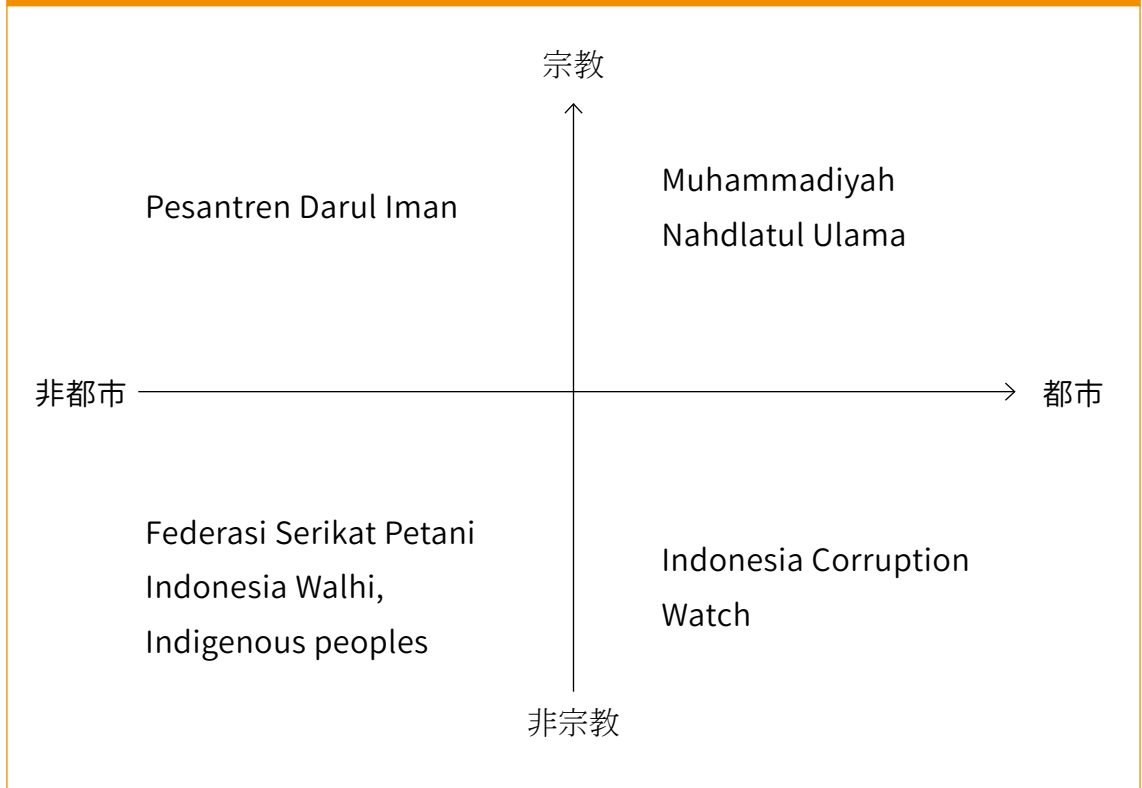
圖一、印尼公民社會組織分類象限圖